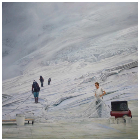
Because it's there , 2006, huile sur toile

Les œuvres de l'exposition Hybris et Némésis tirent leur origine, pour reprendre les mots de l'artiste, de flaques de couleurs qui s'étendent et se mêlent lentement par une dynamique des fluides difficile à contrôler, et qui deviennent de vastes territoires accidentés. Avec cette série d'œuvres inédites, délaissant ses habitudes de tout vouloir contrôler, prévoir, planifier, le peintre Dominique Gaucher réagit à ce qui se produit sur la toile. Ouvert aux pertes de contrôle, l'artiste s'oblige ainsi, parfois, à suivre jusqu'au bout des pistes où il s'égaré. À prendre des libertés. À vivre l'imprévisible. Cette exposition en deux volets présente de ce fait les deux faces d'une attitude, qui oscille de la démesure — ambition aveugle, insolence — à la réprimande de cette démesure — vengeance divine qui met en évidence la fragilité de l'humain devant la puissance des éléments. De là le titre de l'exposition, Hybris et Némésis .